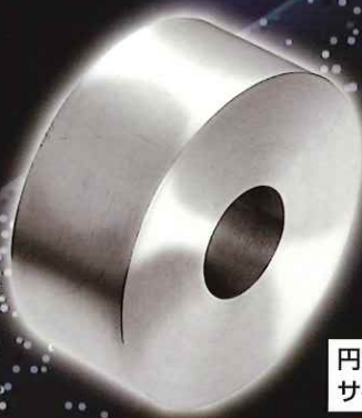
円筒用スーパードレッサII サイズφ60×25W×φ20