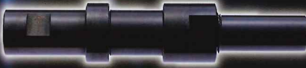
ドレスアーバー(別売) サイズφ20×130L